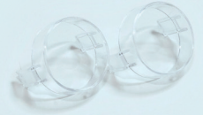
光源キャップ(クリア)