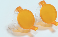
光源キャップ(オレンジ蓋付)